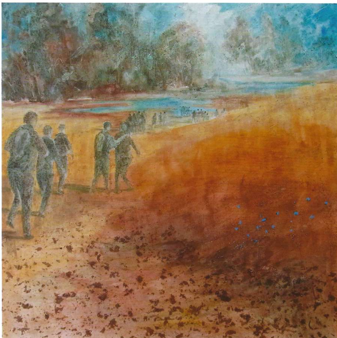
Les pèlerins, 2017, 80x80 cm

Exil: fluidité des mondes, porosité des frontières. Se frotter aux différences aiguise ses perceptions. Partir pour mieux revenir?