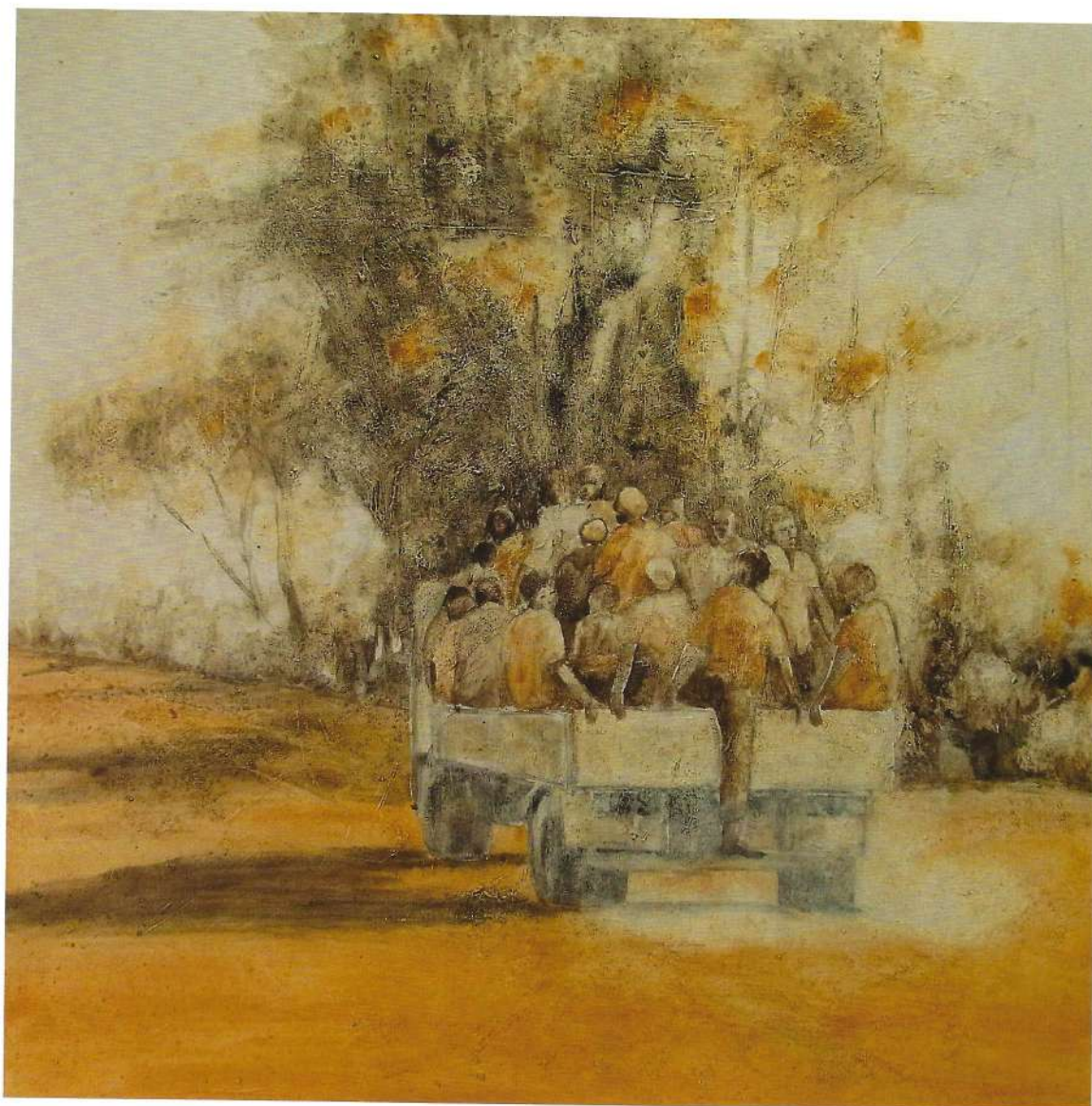
Terre battue, 2017, 80x80 cm

Une personne, multiples facettes. Une foule, multiple reflet. Rester perméable, solidaire, humain.