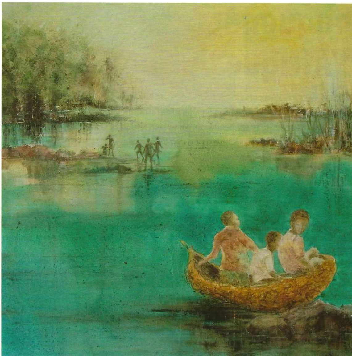
La coquille, 2017, 80x80 cm

Voir comme un enfant, se laisser surprendre, s'émerveiller.