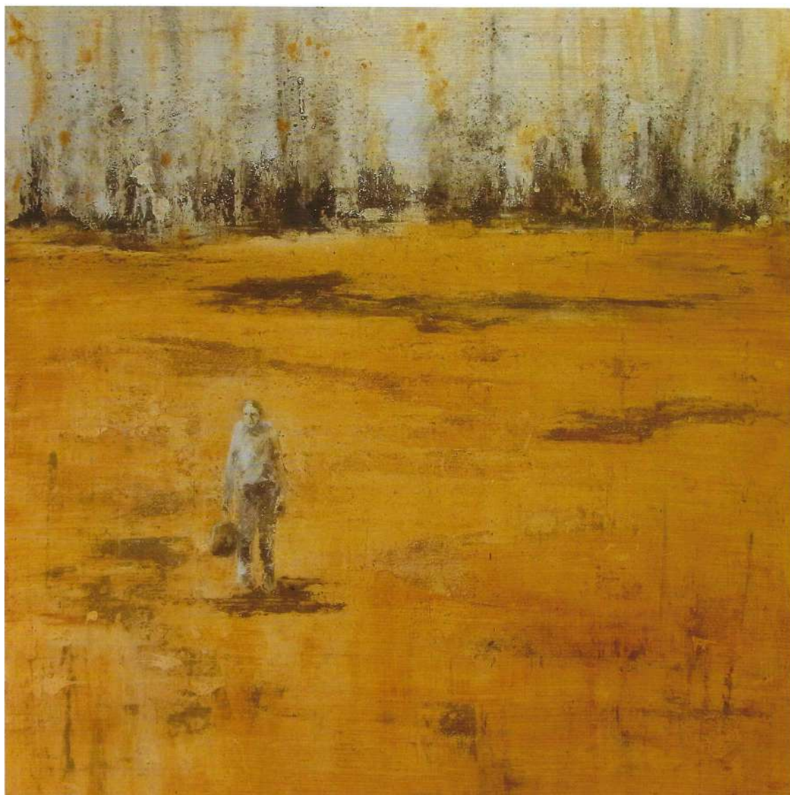
Seul, 2017, 80x80 cm

Sa vie dans un simple bagage. Les solitudes ne sont pas toutes pareilles. Devenir sans cesse. Foi dans un possible malgré et contre tout. Le voyage peut se faire sans grandes distances.