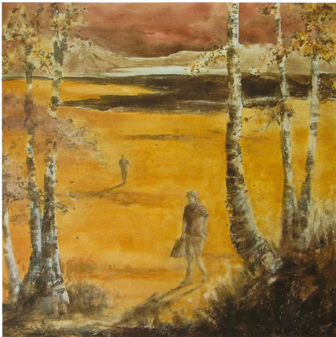
À l'orée, 2017, 100x100 cm

Monde inconnu, espéré, rêvé. Aussi source d'angoisse.